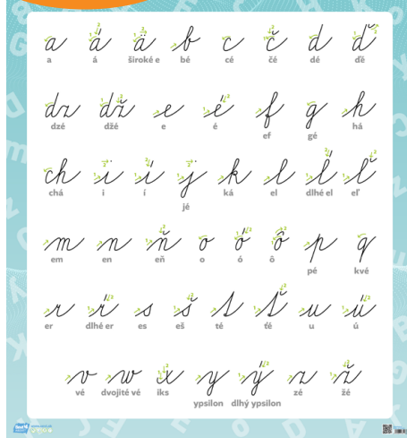
GI 002 4AB