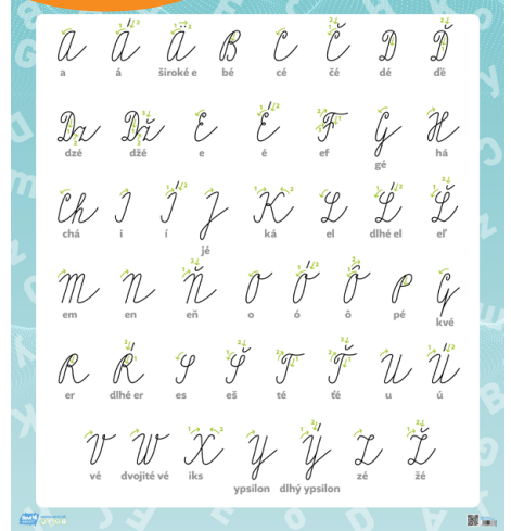
GI 002 4AC