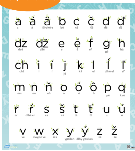
GI 000 3I