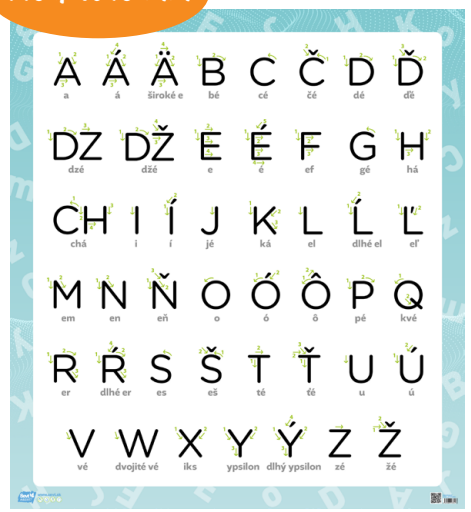
GI 002 4AA